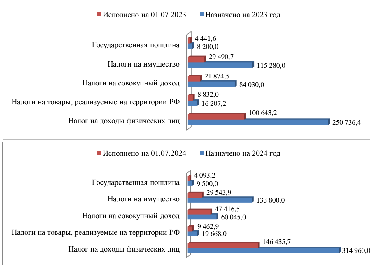
Рисунок 2. План налоговых доходов и исполнения плана налоговых доходов по состоянию на 01.07.2023 и 01.07.2024, тыс. рублей

Данные взяты из отчета об исполнении бюджета Борисоглебского городского округа за 1 полугодие 2023 года (постановление администрации городского округа 12.07.2023 №2130) и анализируемого отчета за 1 полугодие 2024 года.