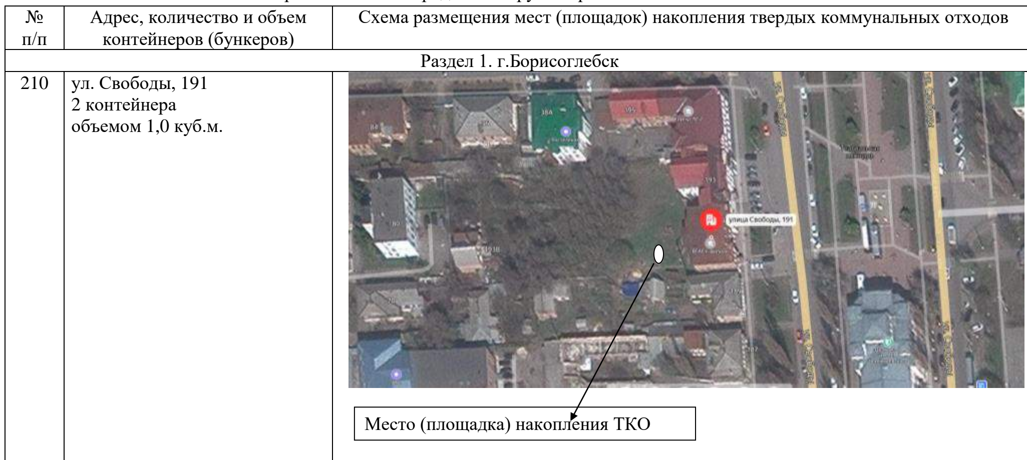
Схема размещения мест (площадок) накопления твердых коммунальных отходов на территории Борисоглебского городского округа Воронежской области