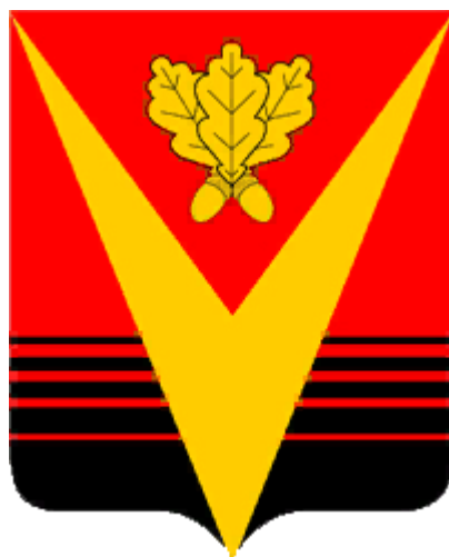
СХЕМА ТЕПЛОСНАБЖЕНИЯ МУНИЦИПАЛЬНОГО ОБРАЗОВАНИЯ БОРИСОГЛЕБСКОГО ГОРОДСКОГО ОКРУГА С 2012 ПО 2027 ГОД. АКТУАЛИЗАЦИЯ НА 2025 Г.