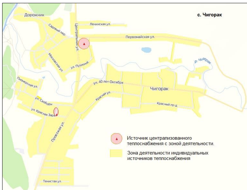
Рисунок 2.1.2. Эксплуатационные зоны действия теплоснабжающих и теплосетевых организаций, зоны действия индивидуального теплоснабжения с. Чигорак.