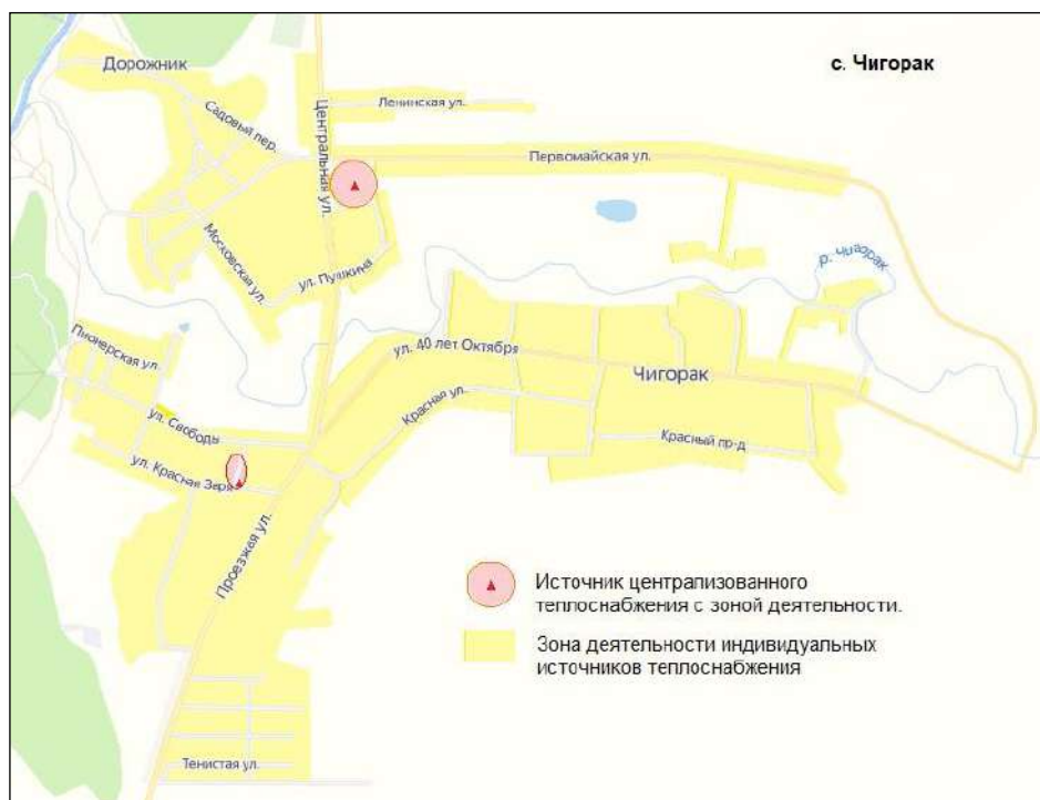
Рисунок 2.1.2. Эксплуатационные зоны действия теплоснабжающих и теплосетевых организаций, зоны действия индивидуального теплоснабжения с. Чигорак.