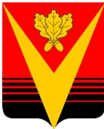
СХЕМА ТЕПЛОСНАБЖЕНИЯ МУНИЦИПАЛЬНОГО ОБРАЗОВАНИЯ БОРИСОГЛЕБСКОГО ГОРОДСКОГО ОКРУГА С 2012 ПО 2027 ГОД. АКТУАЛИЗАЦИЯ НА 2025 Г.